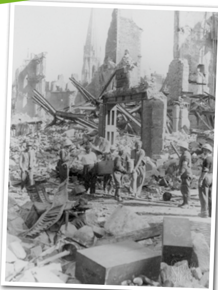
Bombardements de Nantes - Septembre 1943

En soirée, déplacement à Corcoué-sur-Logne. Exploration du côteau Ste Radegonde, mérovingien et chrétien.