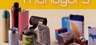
Boîtes et bouteilles métalliques