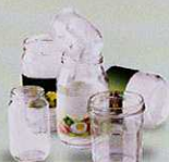
Bocaux et pots