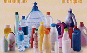
Bouteilles et flacons plastiques