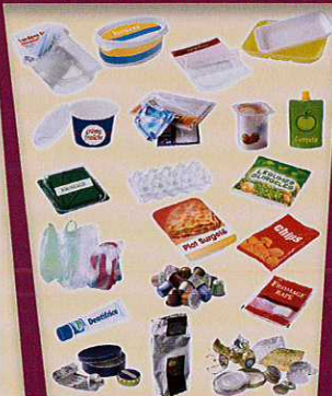
Petits objets en aluminium